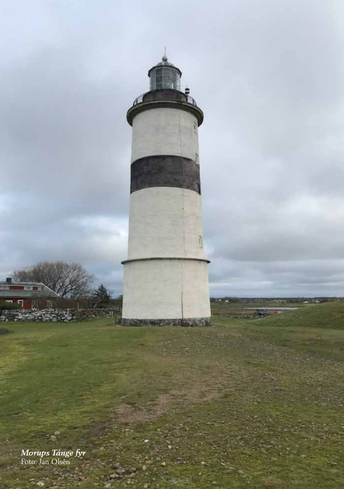
Morups Tånge fyr