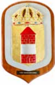
Arholma , M72, byggd 1983, skrotad 2024, ett tidigare fartyg med samma namn fanns, M53. Obs. ej fyr men väl den vackra båken på vapenskölden.