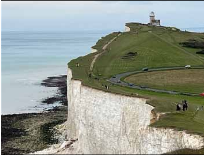
Vandringsleden uppe på klippkusten Seven Sisters är mycket populär. Längre bort syns Belle Touts Fyr torn från 1834 som var Beachy Heads föregångare.