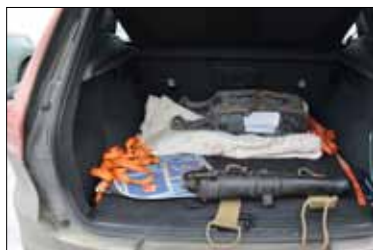
Den av Fyrsällskapet inköpta originalkanonen.

På eftermiddagen den 19 mars lämnade vi Daniel och Kinnbäck för färd söderut mot Bjuröklubb. De 2 milen från E4 fram till fyren var isig väg med två hjulspår, som var isfria. Sista backen upp till fyren saknade dock hjulspåren.