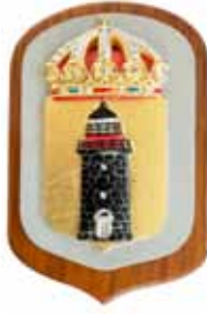
Holmön , M56, byggd 1940, utrangerad 1964