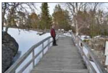
Träspången som ger en möjlighet för alla att ta sig upp till fyren.