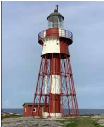
Hon? Måseskär med sin vida kjol.

Vem är fyren för dig? Den, hen, han eller hon? Det får du känna efter själv!