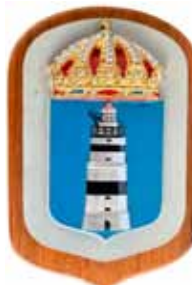
Örskär , M62, byggd 1941, utrangerad 1966