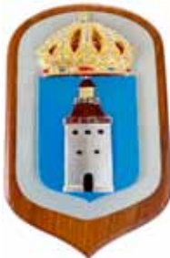
Landsort , M71, byggd 1980, skrotad 2024, ett tidigare fartyg med samma namn fanns, M54