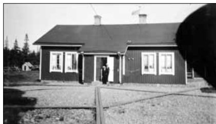
Fyrvaktar- och fyrbiträdesbostaden