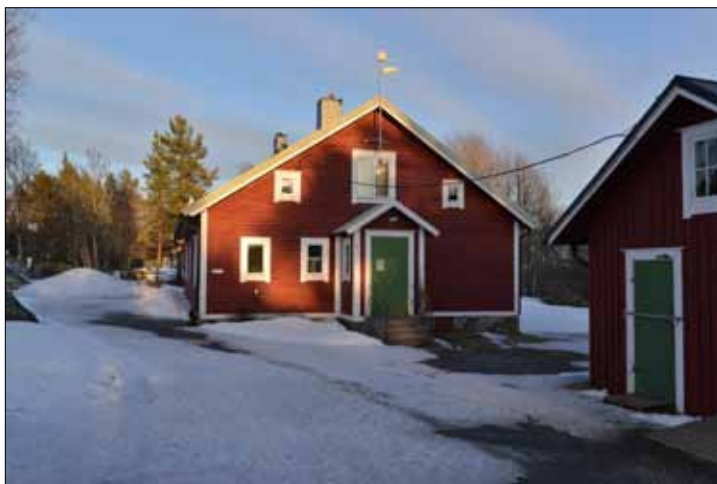
Fyrmästarbostaden som nu fungerar som café med ett utställningsrum.

extern entreprenör i huset förutom ett rum på bottenvåningen. I det rummet visas i text och bild historien om fyr- och lotsverksamheten. Där skulle kanske några av sakerna vi lämnade få en bra placering, och därmed också vara tillgängliga för alla besökare till Bjuröklubb. Totalt besöks fyrplatsen av c:a 23 000 personer under ett år.