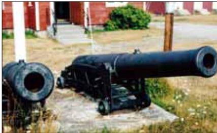
Mistsignalkanonerna på Holmögadd.