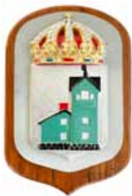
Sandön , M57, byggd 1940, utrangerad 1966. Bilden föreställer fyren på Sandhamn, tidigare benämnd Svea Sandö, alltså inte Gotska Sandön.