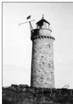
Fyrtornet med knallsignalsapparät.