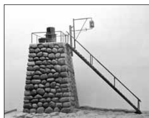
Modell av Holmögadds öppna stenkolsfyr 1780-1838.