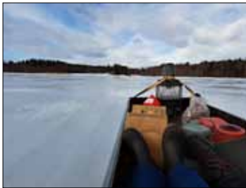
Överfarten till Pite-Rönnskär