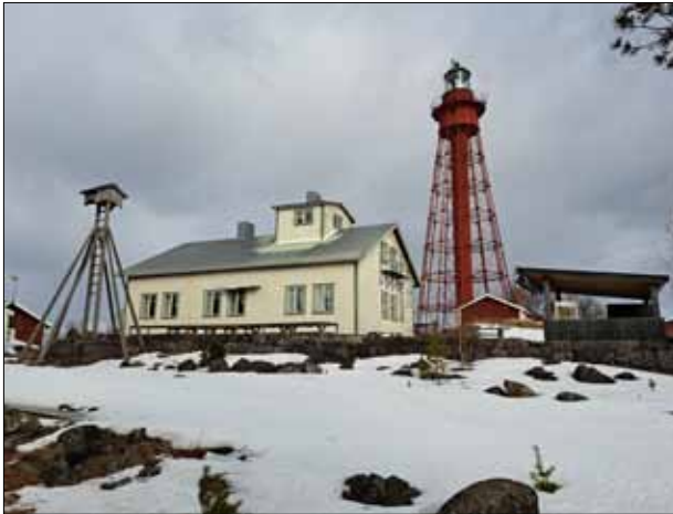
Pite-Rönnskärs fyr med personalbostäder och lotsutkiken

väldigt lite snö och termometern visade + 3-6 grader! Bottenviken utanför fyren var isfri, liksom hamnen. Vi hade kunnat åka båt, men då från annan hamn än Kinnbäck.