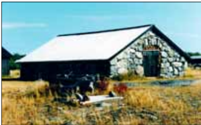
Det gamla kolmagasinet i hamnen på Holmögadd.

- byggs ny fyrvaktarbostad med två rum och stort kök (med bakugn) samt (i södra änden) farstu med skrubben.