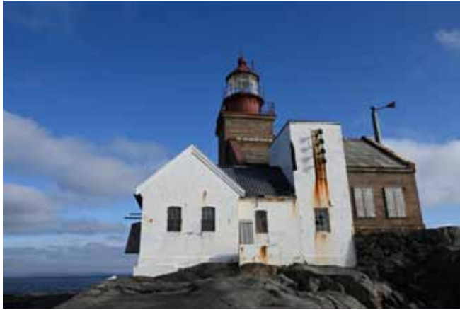
Torbjørnskjær med ett stort renoveringsbehov