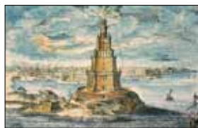
Fyren Pharos, Alexandria