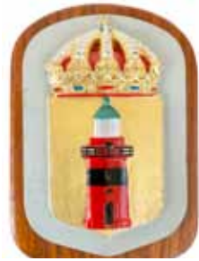
Bremön , M55, byggd 1940, utrangerad 1966, nu Marinmuseum Karlskrona