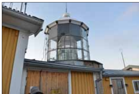
Bjuröklubbs fyr med lanternin och maskinhus.

Bjuröklubbs fyr startade 1859 , blev automatiserad 1970 och då avbemannades fyren. 1997 avbemannades SMHI:s väderstation, och ersattes med en automatisk väderstation. Sedan 1999 är Bjuröklubb en av Sjöfartsverkets referensplatser och sändare för D-GPS.