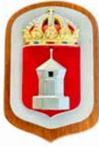
Bredskär , M59, byggd 1940, utrangerad 1966