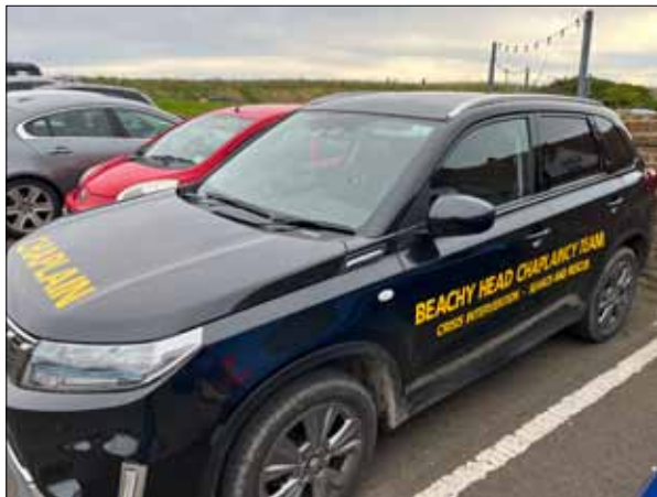
En mörk sida av området kring Beachy Head är de många självmordsförsök som gjorts under årens lopp. Men numera finns en särskild "insatsstyrka" som patrullerar längs klippkanten och försöker assistera människor i behov av hjälp.

Idag vandrar tusentals människor varje vecka på de vita klipporna, Seven Sisters, för att se den vackra fyren ute i vattnet. Tyvärr har också Beachy Head varit känd som den plats i Storbritannien där flest självmord begås och för att hindra människor att kasta sig utför klipporna finns en särskild grupp, Beachy Head Chaplaincy Team, baserad vid parkeringsplatsen. Enligt gruppens egna uppgifter har den ingripit cirka 15 000 gånger sedan 2004.