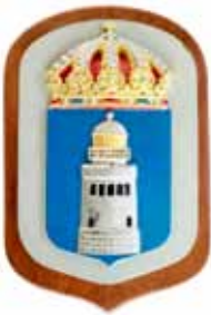
Kullen , M74, byggd 1986, ett tidigare fartyg med samma namn fanns, M 64