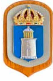
Koster , M73, byggd 1996, ett tidigare fartyg med samma namn fanns, M63