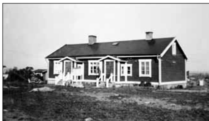
Fyrmästarbostaden med tillbyggd skolsal och lärarinnebostad