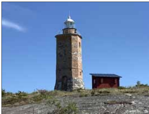
Den? Grönskär tills att man lägger till epitetet Östersjöns drottning då det plötsligt blir Hon?