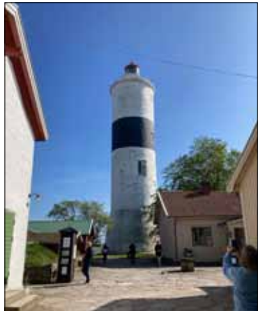
Han? Långe Jan med mansnamn.